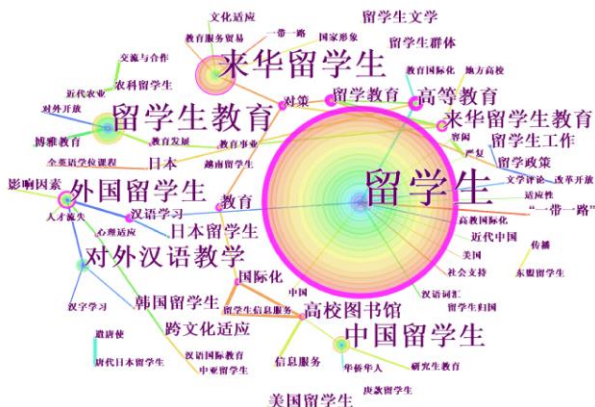
图 3. 1998-2018 年间留学生研究关键词共现知识图谱

CiteSpace, v. 5.0.R7 SE (32-bit) 2019年02月11日 下午09时09分52秒 C:\Users\hwrn\10\Desktop\data Timespan: 1999/2018 (Slice Length=1) Selection Criteria: Top 50 per slice, LRF=2, LBY=8, e=2.0 Network: k=65, E=59 (Density=0.0275) Nodes Labeled: 5.0% Pruning: Pathfinder