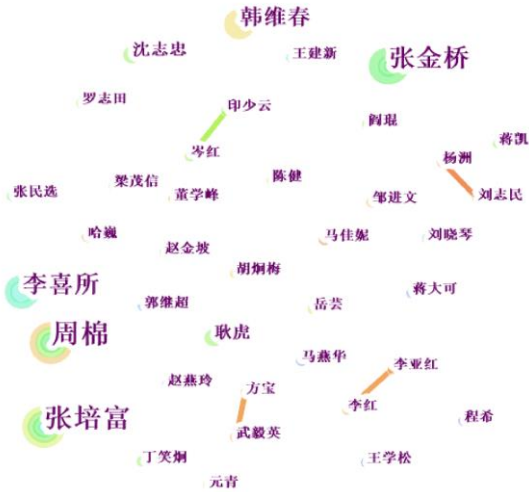
图 1. 1998-2018 年间留学生研究主要高产学者知识图谱

CheSpace, v. 5.0.R7 SE (32-bit) 2019年5月1日 下午10:07分23秒 C:\Users\win10\Desktop\data Timespan: 1998-2018 (Slice Length=1) Selection Criteria: Top 50 per slice, LRF=2, LBY=8, e=2.0 Network: N=38, E=4 (Density=0.0057) Nodes Labeled: 5.0% Pruning: Pathfinder